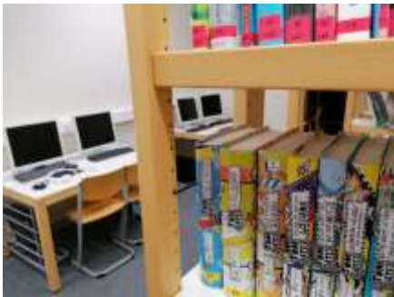
Die ganztägig geöffnete Schulbibliothek

E-Learning, Berufsorientierung, Lernmanagement mit dem Logbuch