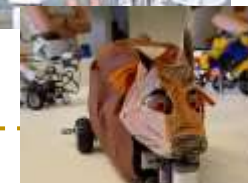
Cooler Lego-Modelle des Robotik-Clubs

Die Clubs finden zweimal in der Woche nachmittags von 14:20 bis 15:50 Uhr statt. Die Angebote finden entlang unserer Profilschwerpunkte „Natur & Technik“, „Sport & Gesundheit“, „Kunst & Handwerk“ sowie „Sprache & Kultur“ statt. Hier lernen die Kinder interessengeleitet und jahrgangsübergreifend. Sie können innerhalb ihrer Profile aus einer Vielzahl an spannenden Angeboten frei wählen. Für jedes Kind ist etwas dabei!