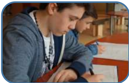
Arbeiten im Lernbüro

Die Hauptfächer sind ein wichtiger Lernbaustein eines Schultages. Täglich findet morgens das Lernen in Deutsch, Englisch oder Mathe statt. Hier lernen die Kinder überwiegend in ihren Klassen und zum Teil auch im Lernbüro. Einen hohen Stellenwert bildet das individualisierte Lernen. Die Kinder arbeiten gemeinsam, aber immer auch mit einem hohen Maß an Selbstständigkeit, an den Themen in ihrem eigenen Tempo.