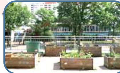
Das Projekt „Urban Gardening“

Nachmittags finden die Clubs statt. Tanzen, Fußball, Robotik, Schach, Dart und Rennradfahren...für jedes Kind ist etwas dabei. Ebenfalls unterrichten unsere Schulsozialarbeiter:innen das Fach „Soziales Lernen“.