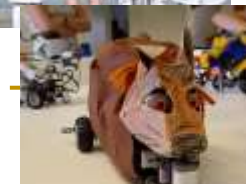
Cooler Lego-Modelle des Robotik-Clubs