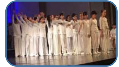
Theaterwerkstatt „Die Schöpfung“

Die Werkstätten werden von den Kindern angewählt und in vier Bereiche aufgeteilt. Es gibt Werkstätten im Forschenden, im Bewegenden, im Handwerklichen und im Künstlerischen. Hierbei können die Kinder die unterschiedlichsten Dinge lernen, z.B. Musizieren, mit