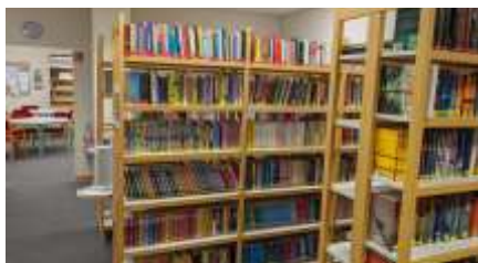
Unsere ganztägig geöffnete Schulbibliothek

Eine Schule für alle: Kinder verschiedenster Herkunft, verschiedener Begabungen und mit unterschiedlichsten Talenten lernen gemeinsam