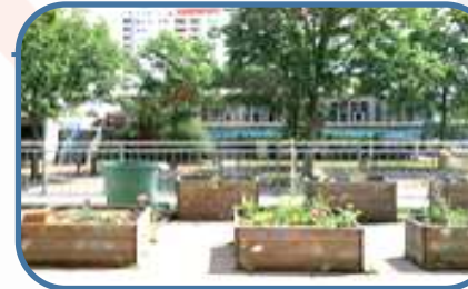
Das Projekt „Urban Gardening“

Nachmittags finden die Clubs statt. Tanzen, Fußball, Robotik, Schach, Dart und Rennradfahren...für jedes Kind ist etwas dabei. Ebenfalls unterrichten unsere Schulsozialarbeiter:innen das Fach „Soziales Lernen“.