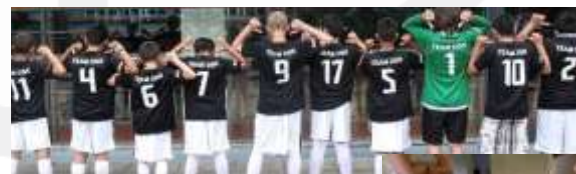
Die „OSK-Elf“ des Fußball-Clubs